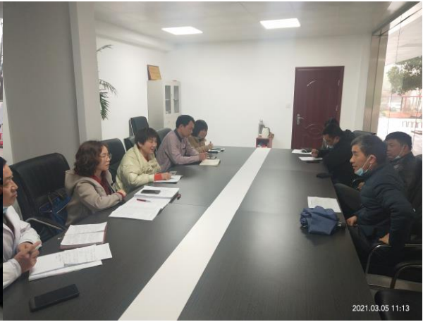
医疗保障规范管理工作会