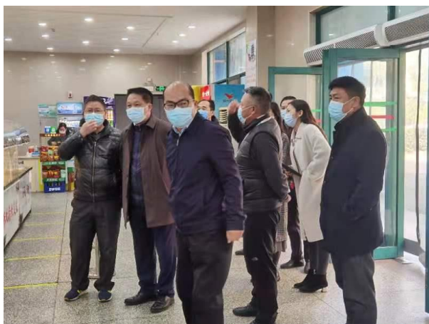
教育厅领导检查后勤工作