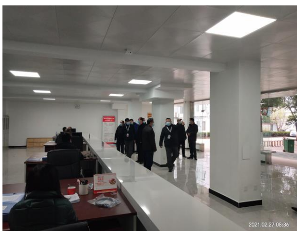
校领导检查后勤工作