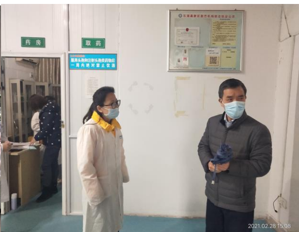
集团领导后勤开学准备检查