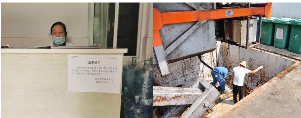
学生宿舍安全提示