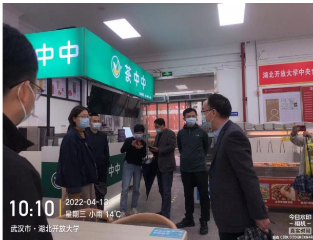
上级领导检查食堂工作