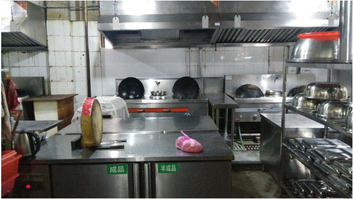
洁净的食堂操作间