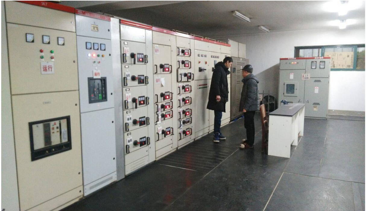
安全的高压配电房