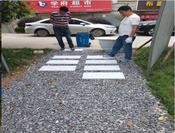
景观道路维修改造