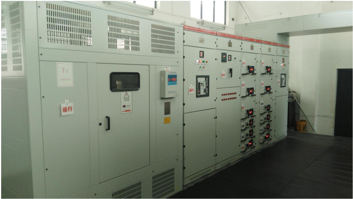
高压配电室安全检查