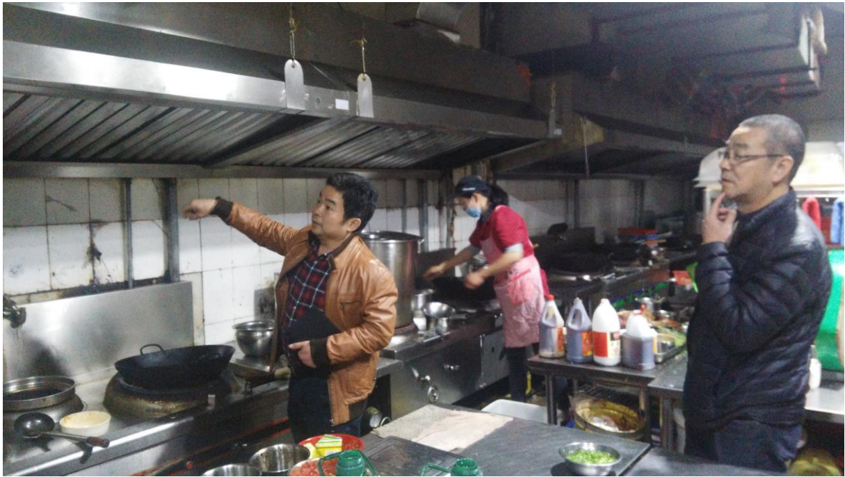
食堂操作间消防安全排查