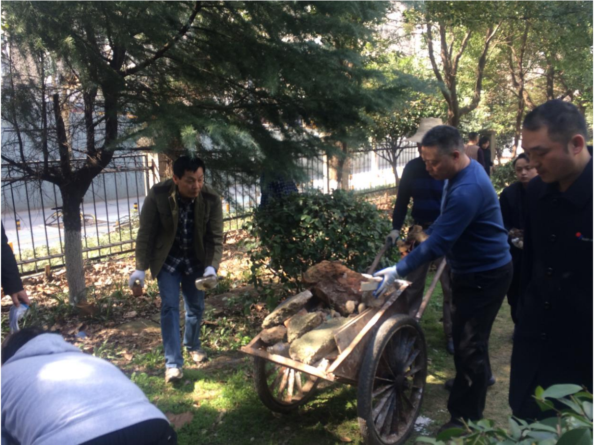
义务劳动美化校园