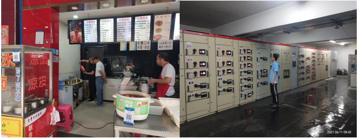
集团节前安全大检查