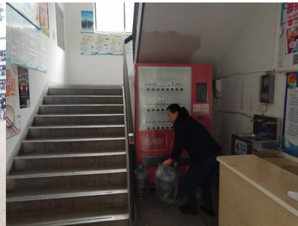
宿舍管理员坚守岗位